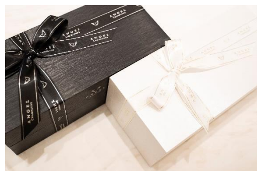
【オリジナルラッピング】

※3：緊急事態宣言に伴い、期間中はカフェスペースでのアルコール類の提供は行いません。正式オープンとなりましたら改めて、お知らせします。