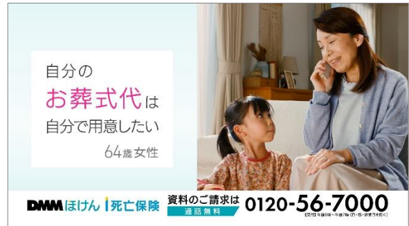
テレビ CM『純烈の1日オペレーター 篇』カット