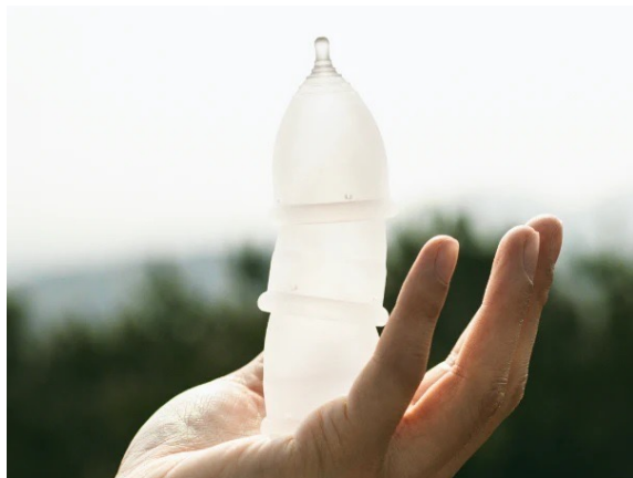
EVE 月経カップ - EVE 価格：¥3,960（税込）

オカモトヤが新たにフェムテック関連商品を仕入れ、企業様に向けて販売を開始します。現時点では15種類のフェムテック商品の仕入れが決まっており、働く女性のミカタとして、あらゆる悩みの解決に貢献します。