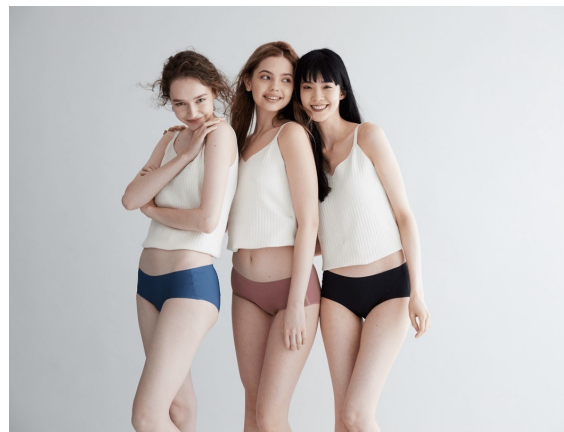
OLTER SHORTS (吸水ショーツ) 価格：¥4,290（税込）～