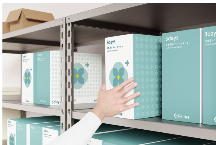
既存の棚の中などに、コンパクトに収納可能です。

災害時は物流もストップ。避難所で支給される女性向け衛生用品も数が限られ、手に入れられない方も多いのが現状です。こうした事態を解消するために作られたのが「災害用レディースキット - 3days BOX」と「災害用レディースキット - ミニマムキット」です。災害用レディースキット - 3days BOXは、3日間のオフィス待機を可能にする女性向け防災備蓄キットです。生理用品をはじめ、リフレッシュシートや夜用ショーツなど、12種類の衛生用品が入っています。災害用レディースキット - ミニマムキットは、働く女性のお守り替わりとして活用いただけるよう、常に携帯可能なコンパクトサイズの災害用レディースキットです。災害時には勿論、急な出張やお泊りの際にも使用できるようホイッスルや絆創膏を始め、8種類の衛生用品が入っています。※購入は、Fellne公式プラットフォーム上で受け付けております。新規のお客様は、Fellneお客様センター（fellne@okamotoya.co.jp）までご連絡ください。