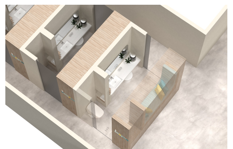
立つ・座るだけでなく、横になることも可能です。