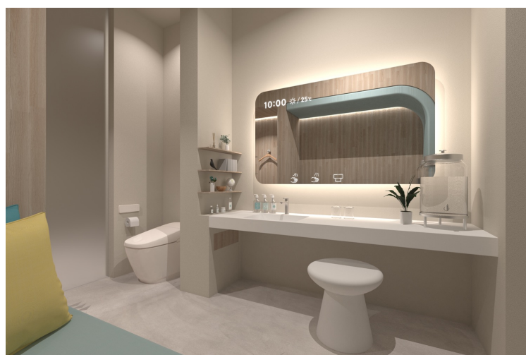
「セルフメンテナンス」機能も付加しています。