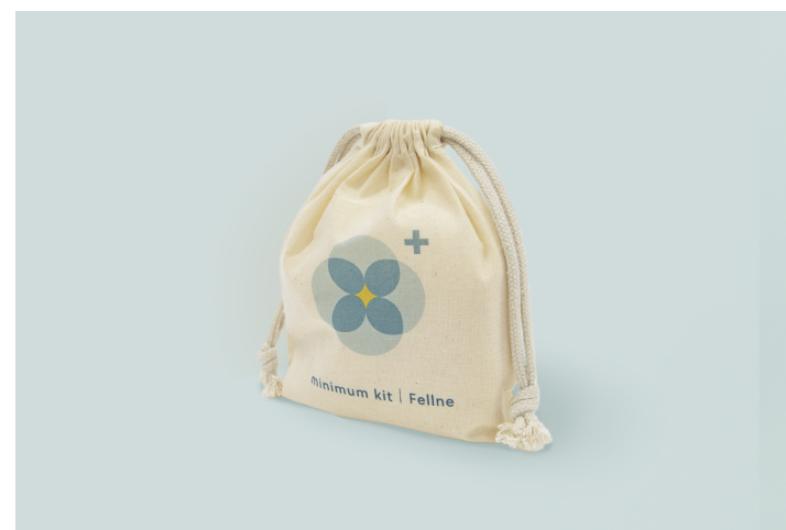
災害用レディースキット - ミニマムキット 価格：¥3,850（税込）