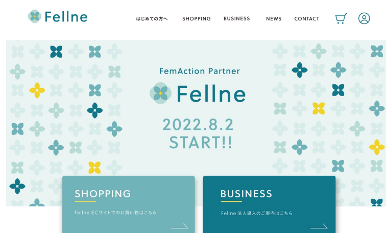
様々なフェムアクションを、カタログ的に一覧することが可能です。

Fellneを導入いただいたお客様が、様々なフェムアクションの中から自社に合ったものを気軽に選択してすぐに実施できるように、Fellne専用WEBプラットフォームを作成しました。ショッピング機能も完備しており、Fellneを導入いただいている企業で働く方々は、こちらのプラットフォームから必要なフェムテック関連商品を注文することが可能です。