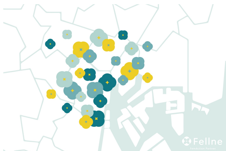
1つのフェムアクション=1つの花。 社会をフェムアクションで満開にすることを目指します。ご契約企業&従業員様限定のフェムアクション関連商品が購入できる「Fellne Store」も展開します。