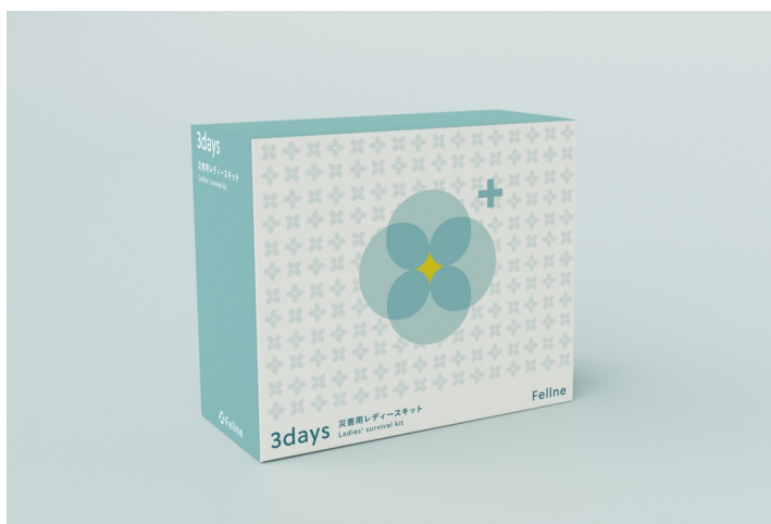
災害用レディースキット - 3days BOX 価格：¥7,700（税込）