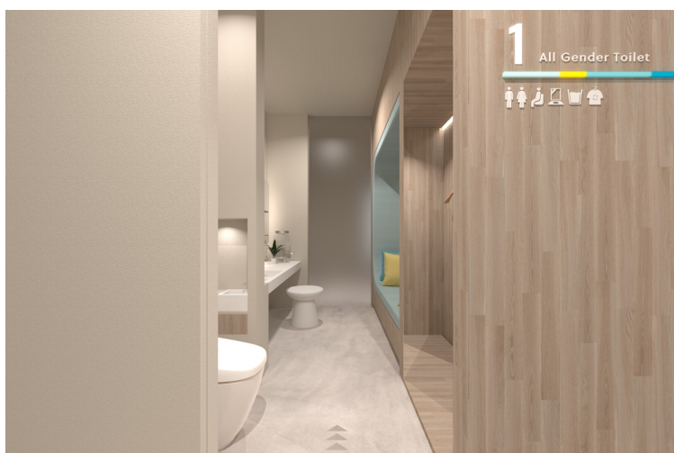
入口と出口を分けた一方通行型のトイレです。

※導入相談はFellne公式プラットフォームにて受け付けております。新規のお客様は、Fellneお客様センター（fellne@okamotoya.co.jp）までご連絡ください。