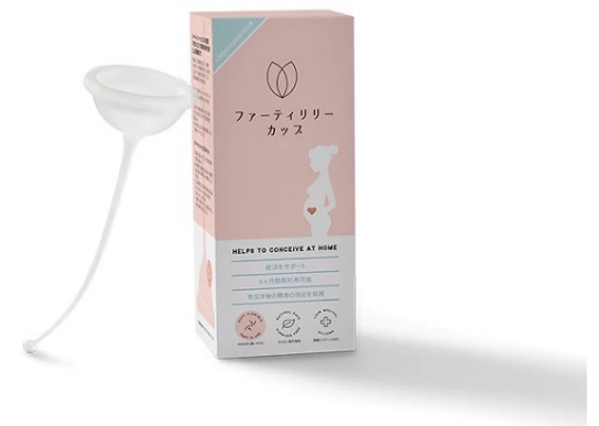
ファーティリリー カップ (妊活サポート) - FERTI-LILY 価格：¥4,950（税込）