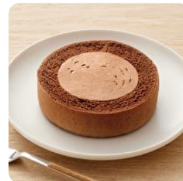
豆乳クリーム ロールケーキ チョコ（卵・乳不使用）