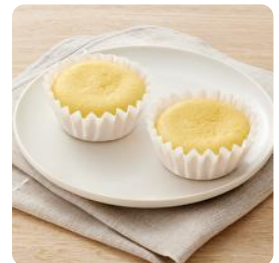
豆乳とお野菜のマフィン （卵・乳不使用）