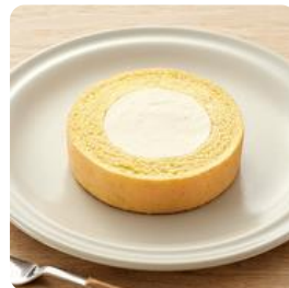
豆乳クリーム ロールケーキ プレーン（卵・乳不使用）

※商品によっては同製造ラインで特定のアレルギー物質を含む商品を製造している場合がございます。