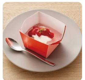
豆乳のカップデザート ストロベリー