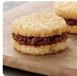
ライスバーガー 大豆ミート 焼肉味

※原材料を細かくさかのぼった起原原料や製造工程において、一部動物性原材料が含まれる場合があります。