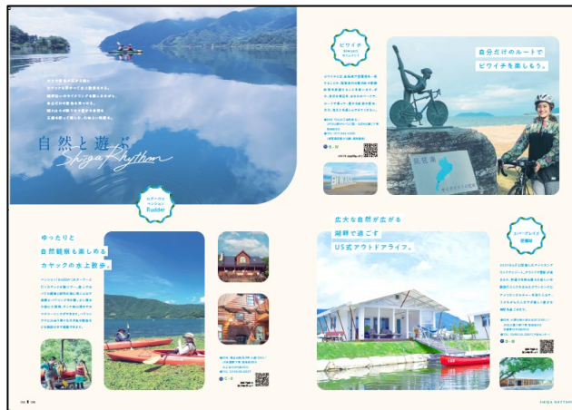
自然と遊ぶシガリズム