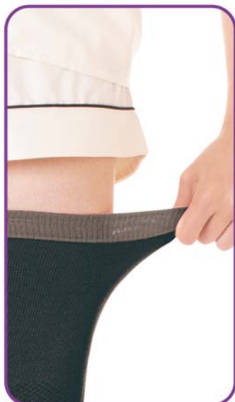
やさしくフィット