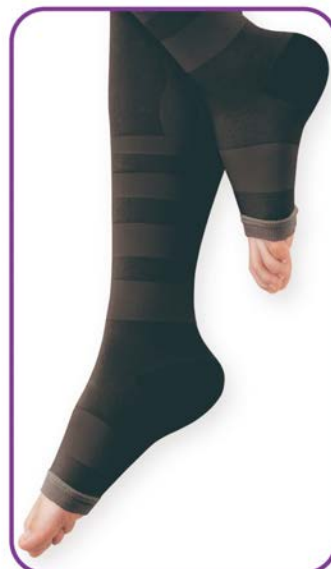
オープントウタイプ