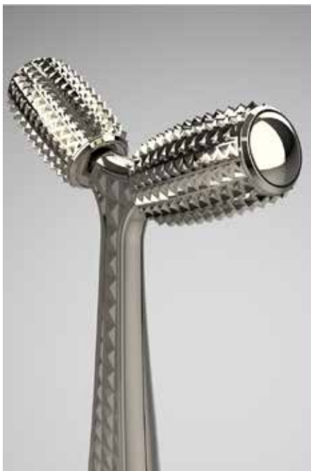
ボディエステローラー