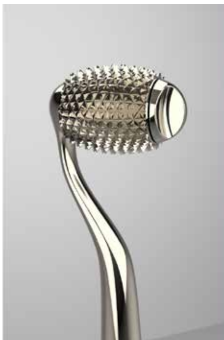
フェイシャルエステローラー