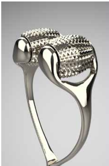
ほほあごエステローラー