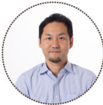
睡眠健康指導士(初級)

私たち自身も日々の疲れを抱えながら働く中で、スタッフ同士意見を出し合い、どのようなクッションが限られた休憩時間の中で快適な睡眠が出来るかを追求し、十数回にわたり試作を繰り返し完成させました。数回にわたり意見交換させて頂きながら、アドバイスを頂いた工場の技術者の方にも、この場を借りて感謝を伝えたいと思います。自信を持っておすすめしたいクッションが出来上がりましたので、お1人でも多くの方にご使用いただきたいと思います。