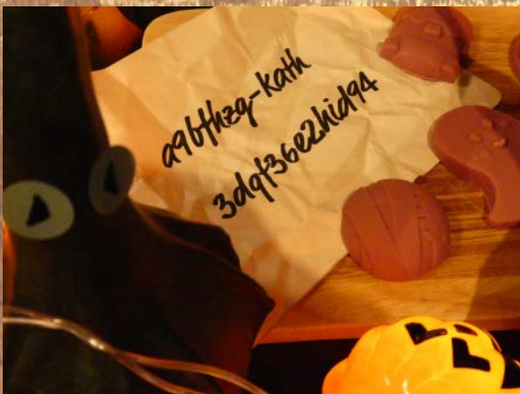
落ちていたメモ用紙