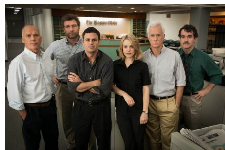
記者たちが巨大権力を相手に正義を貫く姿を描いた実話『スポットライト 世紀のスcoop』