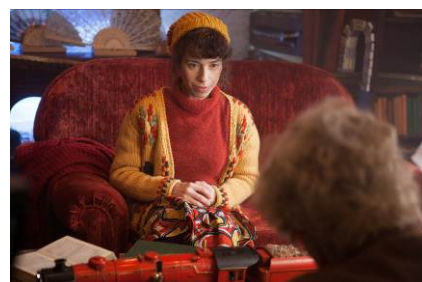
© 2014 STUDIOCANAL S.A. TF1 FILMS PRODUCTION S.A.S Paddington Bear™, Paddington™ AND PB™ are trademarks of Paddington and Company Limited