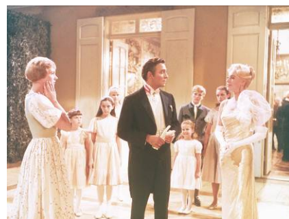
THE SOUND OF MUSIC