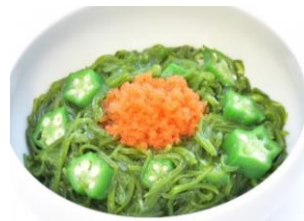
とびっこにプラス