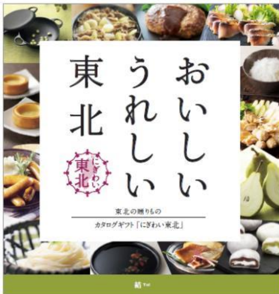
＜結（ゆい）コース＞3,600円（税別）

イオンは今後も、全国に広がるグループの店舗網やインフラを最大限に活用し、地産域消、地産全消を積極的に推進し、地域経済の活性化に貢献してまいります。