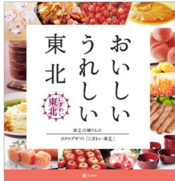
＜彩（いろどり）コース＞5,600円（税別）