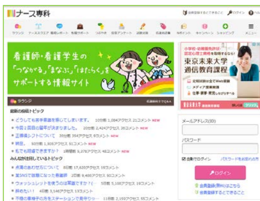
ナース専科 PC サイト http://nurse-senka.jp/

一般的に、『忙しく』『女性が多い職場』のイメージが強く、出会いが少ないと言われている看護師。2016年6月に『ナース専科』の看護師会員に聴取した『婚活サービスに関するwebアンケート』（母数：628人）でも、25～29歳の未婚率が72.4%（一般女性25～29歳未婚率：61.0%※）、30～34歳の未婚率が48.8%（一般女性30～34歳未婚率：33.7%※）という結果となり、相対的に未婚率が高い状況となっています。※2015年国勢調査より