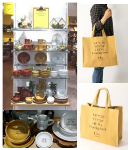
売場・商品イメージ/ノベルティ

オープンを記念して、「Lbc with Life ららぽーと海老名店」の限定グッズを作りました。海老名店の位置する緯度・経度と「ebina」「kanagawa」のタイピングをデザインに落とし込んだ、ここでしか手に入らない、オリジナルテーブルウェアです。マグカップ、プレート、ボウル（大・小）の4種類で、800円～1,200円(税別)。日本製、美濃焼の陶器は、手になじむぽってりした厚みと、落ち着きある色味が印象的です。