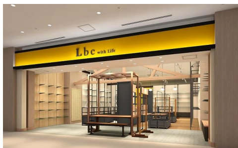
店舗イメージ画像

「Lbc with Life」は、グリーン（植物）やその関連商品を基軸に、テラスやカフェのシーンを提案するとともに、オリジナル雑貨やインポート商品、メンズやキッズにも対応したエイジレスな商品をラインアップした、「自分らしさ」にこだわりたい大人のためのライフスタイルショップです。