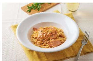
スパゲッティ ロースハムの トマトクリームソース