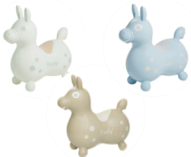
ファミリーに人気の 乗用玩具「RODY」

イタリアの人気玩具ブランド「RODY」の新シリーズ「RODY nino nino」3色のうち1色をプレゼントします。