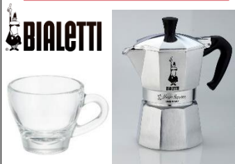
イタリアブランド ビアレッティ

イタリア発ブランド「ビアレッティ」直火式の家庭用エスプレッソマシンとオリジナルマグカップセットです。