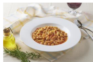
ひよこ豆とパスタ