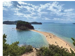
日本でイタリア気分！ 小豆島のホテル宿泊券

温暖な気候から「日本のシチリア」と呼ばれる小豆島への宿泊券をペアでプレゼントします。