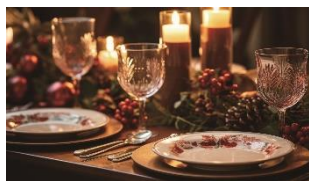
日本イタリア料理協会 加盟店お食事チケット

イタリアの人気玩具ブランド「RODY」の新シリーズ「RODY nino nino」3色のうち1色をプレゼントします。