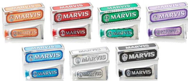
「MARVIS」 歯磨き粉（25ml）7種セット

若年層を中心に日本でも人気となっている、イタリアのフィレンツェで誕生し、長年イタリア国民に愛され続けているデンタルケアブランド「MARVIS」のフレーバー7種セットです。