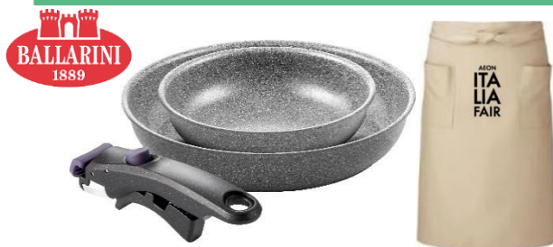
「BALLARINI」フライパンセット +オリジナルエプロン

自社生産のこだわり品質で世界60カ国以上に愛される1889年創業のイタリア発クックウェアブランド「BALLARINI」のフライパンセットと、イオンイタリアフェアオリジナルエプロンのセットです。