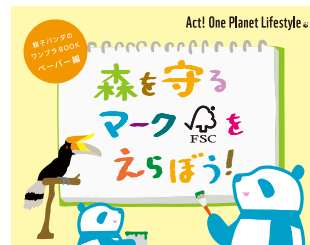
親子パンダ絵本「森を守るマークをえらぼう！」