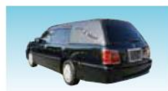
霊柩車(国産車)(50kmまで)