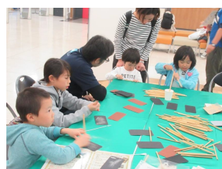
自然資源の利活用