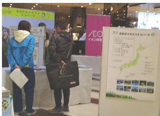
パネル・ポスター展示