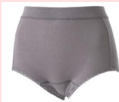
おなかすっぽりタイプ 吸水量：最大30cc