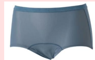
スポーティタイプ 吸水量：最大30cc

これからもイオンは、女性のお悩みに寄り添い、より快適な生活をサポートする商品の企画・開発に取り組んでまいります。