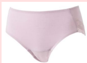
レギュラータイプ 吸水量：最大20cc