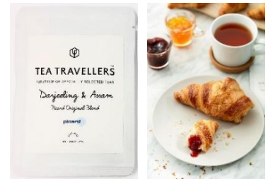
▲オリジナルブレンドティー／クロワッサン

内 容：キャンペーン期間中に「クロワッサン」2個以上または 「クロワッサン」と「ミニクロワッサン」の合計2個以上のお買い上げで、 Picard のクロワッサンにあわせて特別にブレンドした、 オリジナルブレンドティーをプレゼントします。※在庫がなくなり次第終了