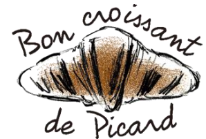
▲「ピカクロデー」ロゴ

内 容：毎月6のつく日(6日/16日/26日)は「ピカクロデー」で 「クロワッサン」と「ミニクロワッサン」が100円OFFになるお得な日。 さらに、「ピカクロデー」にしかもらえないシールを6枚集めると、 オリジナルグッズがもらえる、ピカクロファンのためのスペシャルな日。 キャンペーン期間中は毎日「ピカクロデー」を開催。