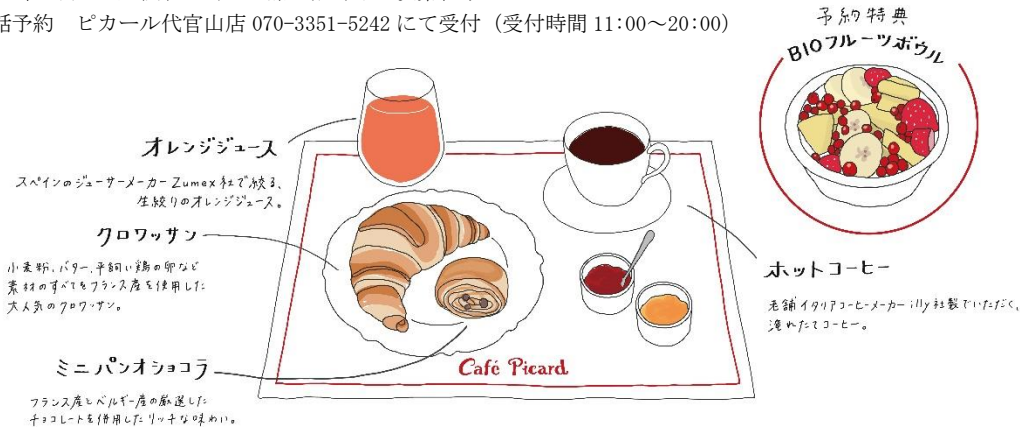
▲提供メニュー「Picard スペシャルモーニングセット」

予約方法：電話予約 ピカール代官山店 070-3351-5242 にて受付 (受付時間 11:00～20:00)