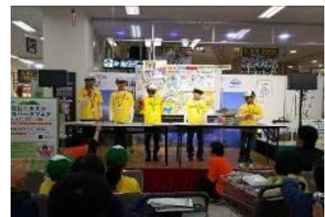
第1回白山ユネスコエコパークフェア (イオン御経塚店)

2017年8月に、日本ユネスコエコパークネットワークと当財団は「生態系の保全」と「持続可能な利活用」の調和を目指し、日本国内のユネスコエコパーク(生物圏保存地域)における3つの機能(保全機能、経済と社会の発展、学術的研究支援)に関し、国内初となる連携協定を締結しました。「生態系の保護保全のみならず、自然と人間社会の共生に重点を置く」というユネスコエコパークの理念に賛同し、日本国内の管理運営機関である日本ユネスコエコパークネットワークと連携のもと、ユネスコエコパークのさらなる発展に向けて取り組んでいます。