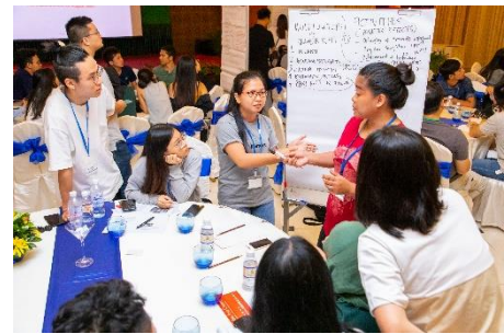
第8回 カンボジアシェムリアップ

本年は、8月9日～11日で「循環型社会の構築」をテーマにオンラインにて実施する予定です。