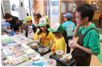
ユネスコエコパークセンターでの 環境教育