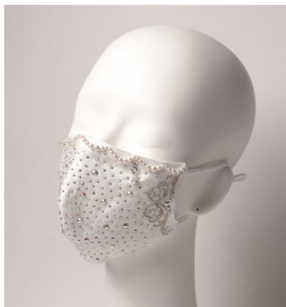
↑デザイン1：オーロラカラー