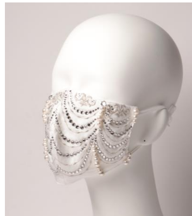
↑デザイン3：シルバーカラー