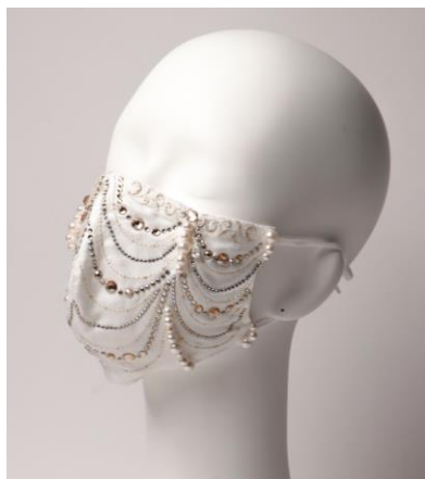
↑デザイン2：ゴールドカラー