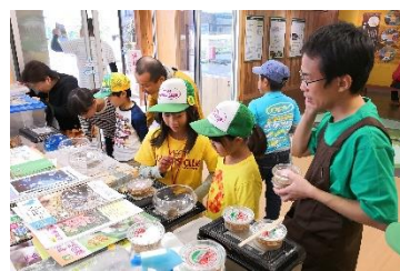
ユネスコエコパークセンターでの環境教育