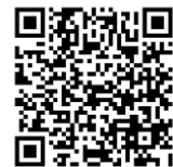
↑ トッパリュ geo organics Instagram アカウント

https://www.topvalu.net/geo_organics/campaign_2nd