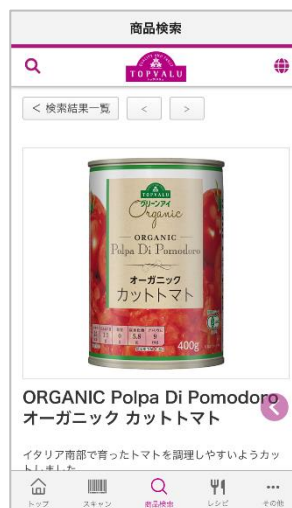
検索商品情報画面