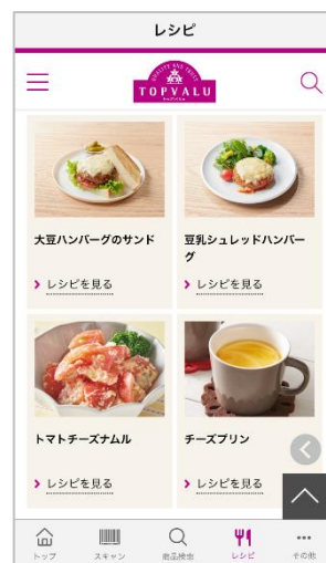
おすすめレシピ画面