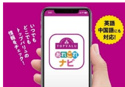
調べて安心、知って納得、かしこくお買い物!

イオンでは、お客さまからトップバリュ商品について年間約5万件(2019年度)のご意見・ご要望・ご質問があり、なかでも「商品の使用方法」や「目安摂取量」「生産地」「製造所」に関する問い合わせを多くいただいています。本アプリでは、商品パッケージの記載情報だけでなく、お客さまの関心が高い情報を店頭の商品やPOPのバーコードから読み取れるほか、商品検索やレシピ紹介、ご意見・ご要望を承る機能も備えています。また、商品情報の一部は英語・中国語にも対応しています。