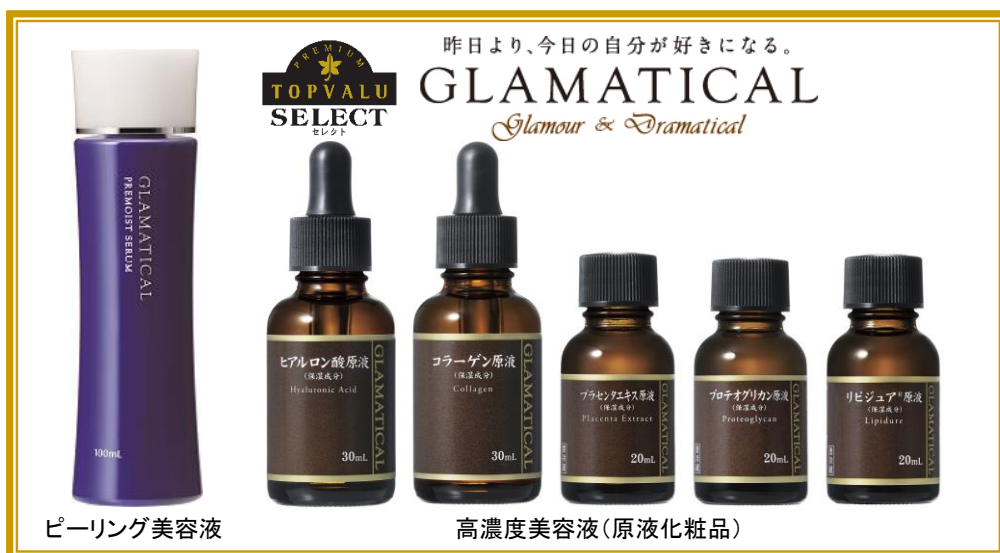
ピーリング美容液

角質を柔らかくし化粧水の浸透を高めるピーリング美容液と、うるおい効果が高いとされているヒアルロン酸やリピジュア®、乾燥によるシワ対策に効果のあるプラセンタなどの化粧品原料100%使用の高濃度美容液（原液化粧品）、計6品目をご提案します。