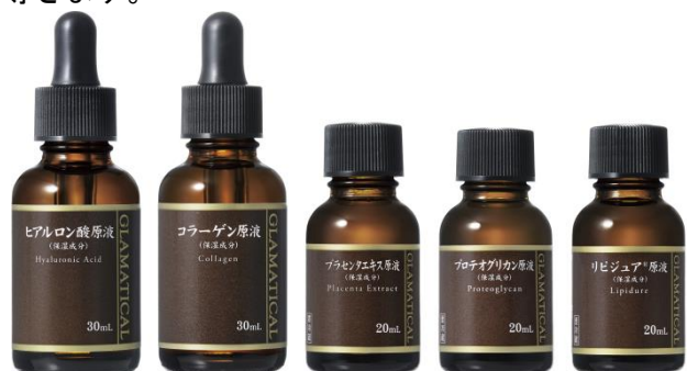
① ② ③ ④ ⑤

特徴：ヒアルロン酸の2倍の保水力を持つ、希少な原液。水や汗に流れにくくうるおいを長時間キープするお肌に満ちたふっくら肌へ。