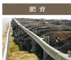
成長ホルモン剤や抗生物質も不使用。安心・安全の取り組みを行っています。