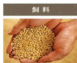
肉骨粉や遺伝子組み換え飼料を一切使わず、自然のままの穀物だけを与えています。