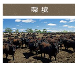
厳しい検疫によって守られている自然環境の中で、伸び伸びと育てられています。