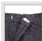
アジャスター付き フロントボタンで ウエストらくらく。

ウエストに沿うカーブベルトでスタイリッシュに見える「トップバリュ ウエストアジャスター付パンツ」(3,686円(税込3,980円))は、ウエスト部分を通常よりも1cm幅広のカーブベルトにし、前の股上を下げることで、お尻にかけてフィットしながらもお腹を締め付けないことで、スタイリッシュなシルエットとラクな穿き心地を実現しました。