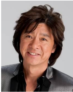
西城秀樹さんプロデュース 「リプラス」

「ファッションで気持ちを明るくしたいのに、リハビリ用のトレーニングシューズは地味なものばかりで、おしゃれを楽しめない」という西城秀樹さんの経験から生まれたこの商品は、機能とファッション性を両立させたもので、“もう一度（RE）プラス（PLUS）な気持ち”で健康維持の運動をサポートする靴です。