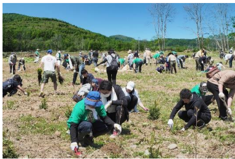
第1回 北海道 南富良野町植樹

各国政府や地方自治体と協力し、自然災害などで荒廃した森を再生させることを目的として、日本はもとよりアジアを中心とした世界各地で植樹を行っています。2019年度国内では、北海道南富良野町、宮城県石巻市、宮崎県綾町、千葉県山武市九十九里浜にて、海外では中国武漢、インドネシアジャカルタ、マレーシア ビドゥにて植樹活動を実施しました。