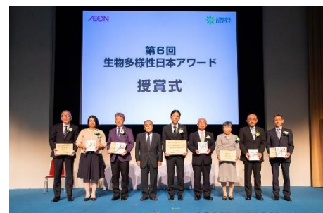
第6回「生物多様性日本アワード」授賞式 （国際連合大学）

本年度は、9月26日（木）に、第6回「生物多様性日本アワード（国内賞）」の授賞式を行い、グランプリには、株式会社コクヨ工業滋賀が選ばれました。