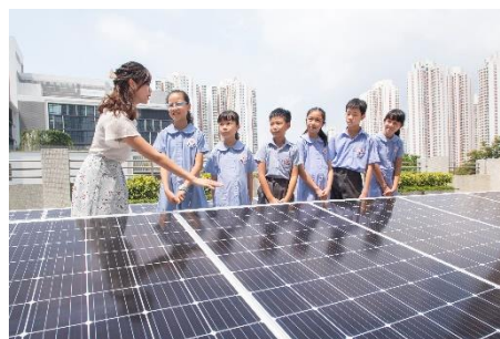
2019年 太陽光発電システム寄贈 （東華三院姚達之記念小学）

再生可能エネルギー活用の啓発・普及および環境教育を目的に、2009年から国内外の小中学校へ太陽光発電システムの寄贈を行っています。これまでに、日本・中国・マレーシア・ベトナムの4カ国で、計48校に寄贈しました。昨年並びに本年は、香港の小中学校計6校に寄贈しました。