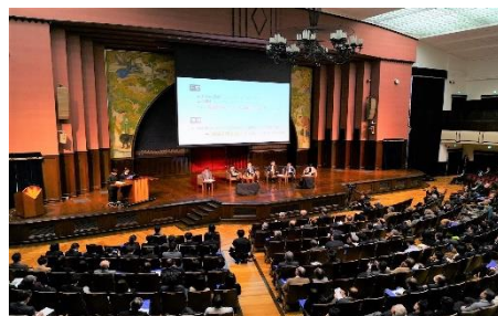
第3回イオン未来の地球フォーラム （東京大学安田講堂）

第4回となる今年度は「海の環境と資源を守る」をテーマに、2020年2月1日（土）に東京大学安田講堂にて開催致します。