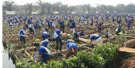
第2回 インドネシア ジャカルタ植樹