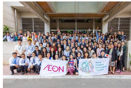
第8回ASEP開講式（王立プノンペン大学）

2019年度は、「持続可能な平和のため」をテーマに、王立プノンペン大学（カンボジア）、清華大学（中国）、インドネシア大学（インドネシア）、早稲田大学（日本）、高麗大学校（韓国）、マラヤ大学（マレーシア）、ベトナム国家大学ハノイ校（ベトナム）、チェラロンコン大学（タイ）、ヤンゴン経済大学（ミャンマー）、フィリピン大学（フィリピン）の10ヶ国、計80名の学生が参加し、「持続可能な平和構築」をテーマに、8月2日～6日の期間、カンボジアのプノンペンとシエムリアップで、開催しました。