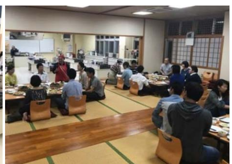
試食タイム&懇親会