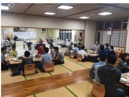
1対1のお見合いトーク