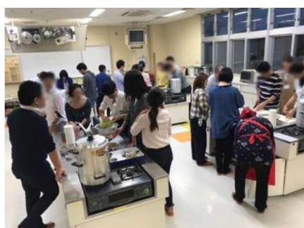
グループに分かれ調理実習