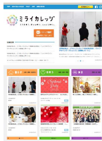
「ミライカレッジ」のホームページ http://miraicollege.jp/