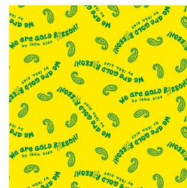
↑進呈するバンダナ

当日は、当社従業員も参加し、小児がんへの理解と周知を広げるためにウォーキングを行ないます。