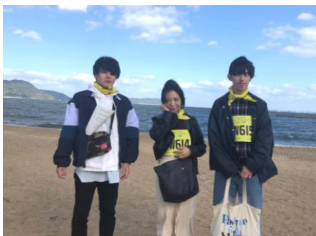
↑当社従業員 本社と近隣店舗から参加しました。

快晴の中、子供から大人まで多くの参加者たちが「マリナタウン海浜公園特設会場」に集まり、マラソン、リレー、ウォークと愛宕浜ビーチ沿いを楽しみました。当社従業員は2kmのウォークに参加し、おそろいのバンダナを付け、小児がんへの理解と周知を広げるためにウォーキングを行ないました。