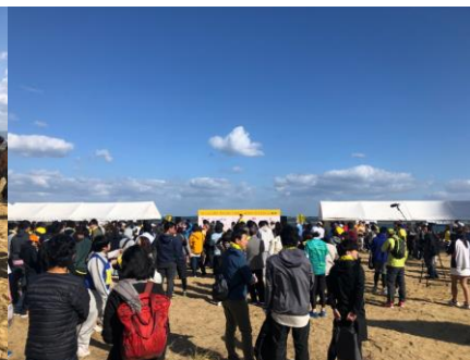
↑ステージ前の様子