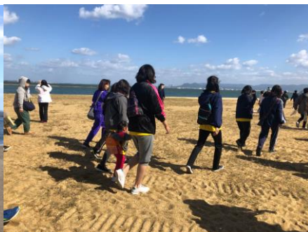
↑ウォーキング風景