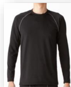
クルーネック長袖

カラダの動きに合わせて伸縮するストレッチ素材を採用。さらに、袖の形は腕を動かしやすいラグランスリーブ※4です。肌側は起毛素材になっているため、ふんわりと包み込むようなあたたかさや柔らかい肌触りが特長です。「静電気防止機能」付きだから重ね着をするときに静電気が起きにくい仕様です。 ※4 袖の付け根が衿から袖下にかけて斜めになっており、肩と一続きになっている袖のこと。