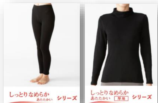
しっとりなめらか あたたかい シリーズ

化粧品としても使用されている天然保湿成分アミノ酸を含むマイクロアクリル糸とレーヨン糸を使用しているため、しっとりなあたたかい肌触りを実現しています。ストレッチ性にも優れ、カラダにフィットする設計です。より厚手のものが欲しいというニーズにお応えし、厚地シリーズも発売します。※厚地シリーズは11月下旬発売。