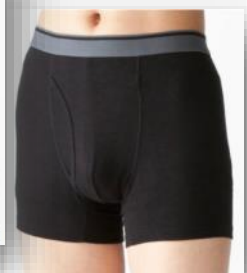
ボクサーブリーフ無地