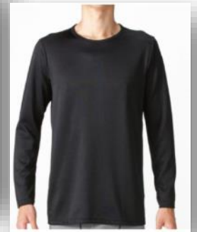
クルーネック長袖