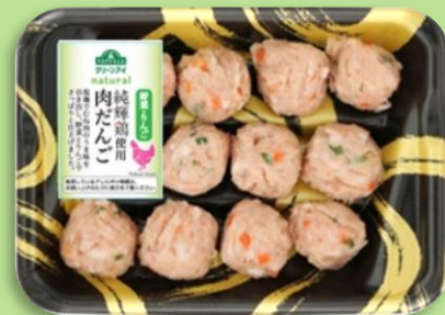
トップバリュグリーンアイ ナチュラル 純輝鶏使用 肉だんご（国産野菜、りんご入り）