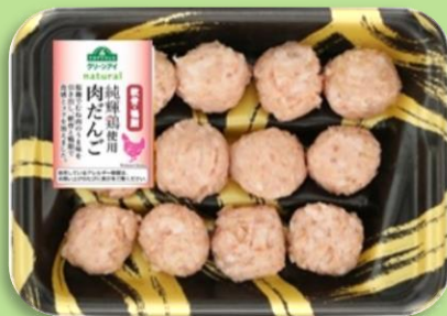
トップバリュグリーンアイ ナチュラル 純輝鶏使用 肉だんご（国産軟骨、国産鴨脂入り）

今回発売する「純輝鶏使用 肉だんご」は、手間をかけずにさまざまなお料理にお使いいただける商品です。野菜を手軽に摂れるお鍋やスープなどのお供に、安全・安心な純輝鶏を使い“鴨脂”など具材の配合にもこだわった“ヘルシー”で“本格派”の肉だんごをお楽しみください。