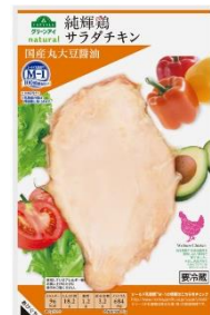
純輝鶏サラダチキン（プレーン・国産バジル・国産丸大豆醤油）