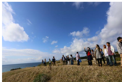
▲過去のツアーイメージ

高野山の魅力を体感できるツアーで、男女の自然な交流を促進。「高野山観光」を始め、「はたごんぼ堀体験」や「普賢院での阿字観体験」などを通じて、単なる観光ツアーにとどまらない、地方暮らしのイメージを具体化できるツアー内容となっています。さらに、婚活のプロが同行し交流のサポートを行います。