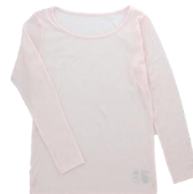
長袖クルーネックTシャツ