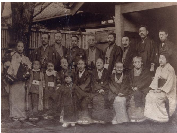
【左上】 観潮楼の玄関前にて 明治30年撮影 父・静男の一周忌記念。後列左より、次女を抱く喜美子、鷗外、3人おいて喜美子の夫・小金井良精。