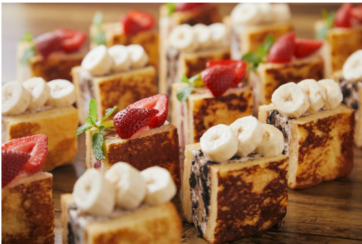
渋谷限定新商品「フルーツサンドプレート」イメージ写真

フレンチトースト専門店Ivorish（アイボリッシュ）は、2022年8月4日ブリオッシュのフレンチトーストで作るフォトジェニックな渋谷限定新商品「フルーツサンドプレート」を1日数量限定、ティータイム限定（注1）でご提供します。カスタードクリームと生クリームを合わせた自家製ディプロマッドクリームに、相性のいい甘酸っぱいイチゴをサンドした「ストロベリーサンド」と、クッキークリームとバナナをサンドした「バナナサンド」を一皿に。あれこれ食べたい女子心をくすぐるデザートプレートを目指して、自家製パンナコッタ、カリッカリでほろ苦い塩キャラメルナッツ、途中で味変を楽しんでいただくためのラズベリーソースを添えた、手間暇かけた一皿に仕上がりました。一つ一つは小さく見えますが、お腹いっぱいになるデザートプレートです。