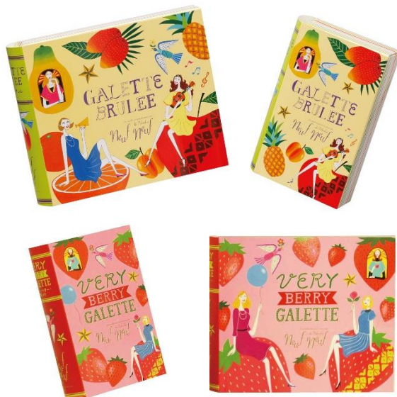
思わず手に取りたくなるブック型パッケージ