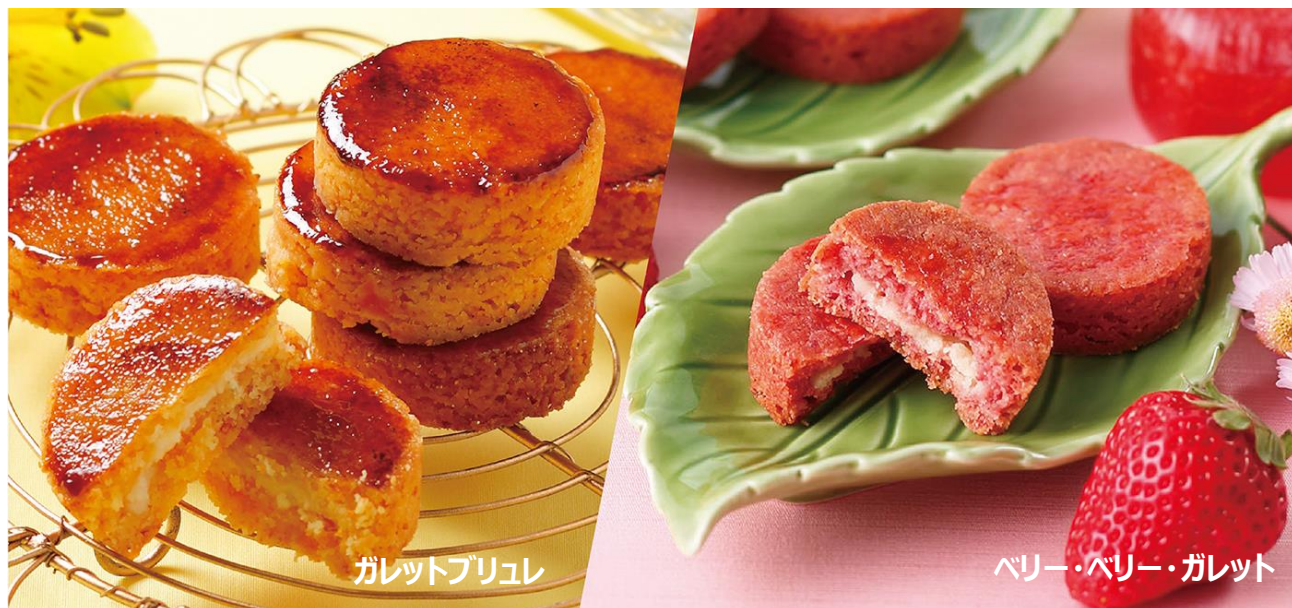
ガレットブリュレ

イラストレーター イフクカズヒコ氏のイラストによるブック型パッケージが手土産に最適。