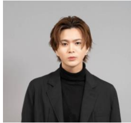
ラーク - Larkiz

プロ eSports チーム「SCARZ」の『Call of Duty』部門で初期から活躍し、日本王者の座を手にした経験を持つ。現在はチームスタッフとして活動中。