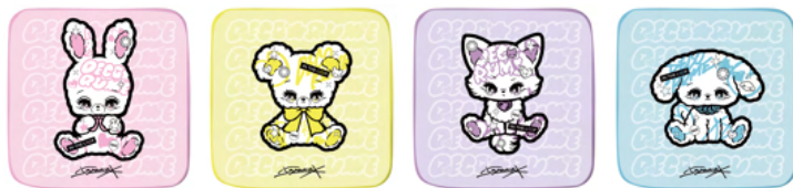
ミニタオル (¥850・税別)