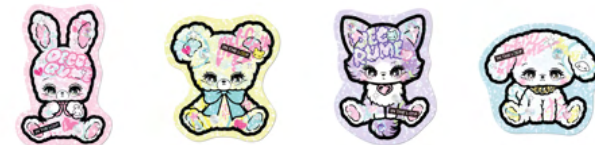
ダイカットホログラムステッカー (¥400・税別)