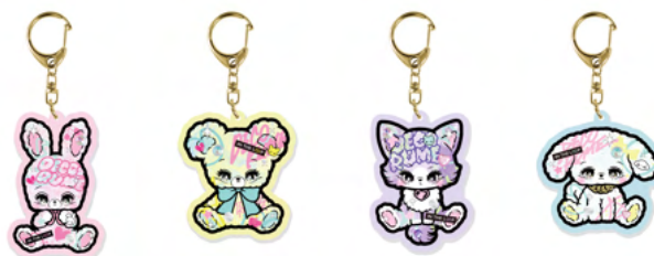
アクリルキーホルダー (¥700・税別)