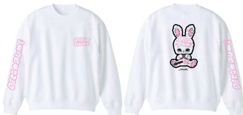
スウェット (¥6500・税別)