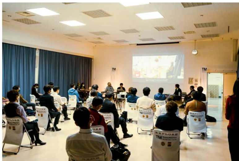
徳島県にて開催した『LOCOVISION』の様子