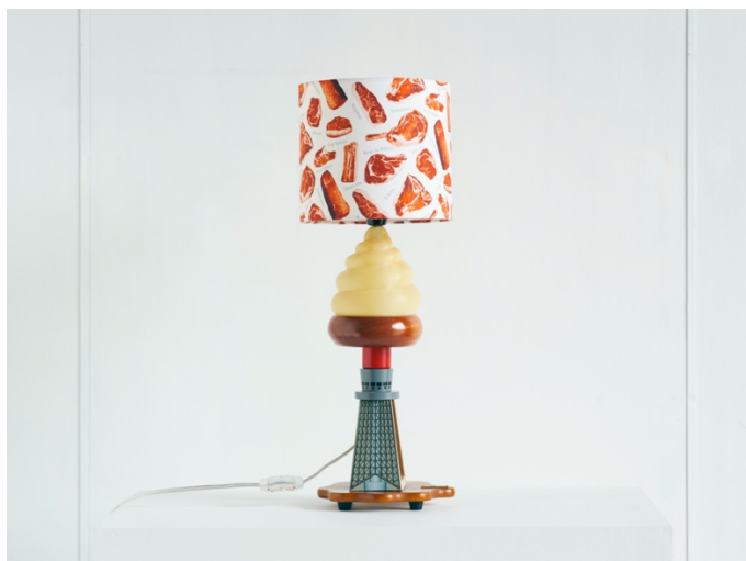
magma 'Tenderloin lamp' 2022, mixed media, W200 x H200 x D530mm