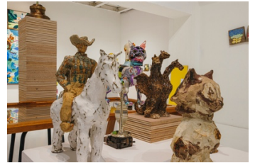
個展'LIVING DEAD STOCK' 2021 at CALM&PUNK GALLERY