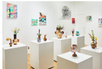
個展'ゴリラがバナナをくれる日に' 2020 at SFT GALLERY