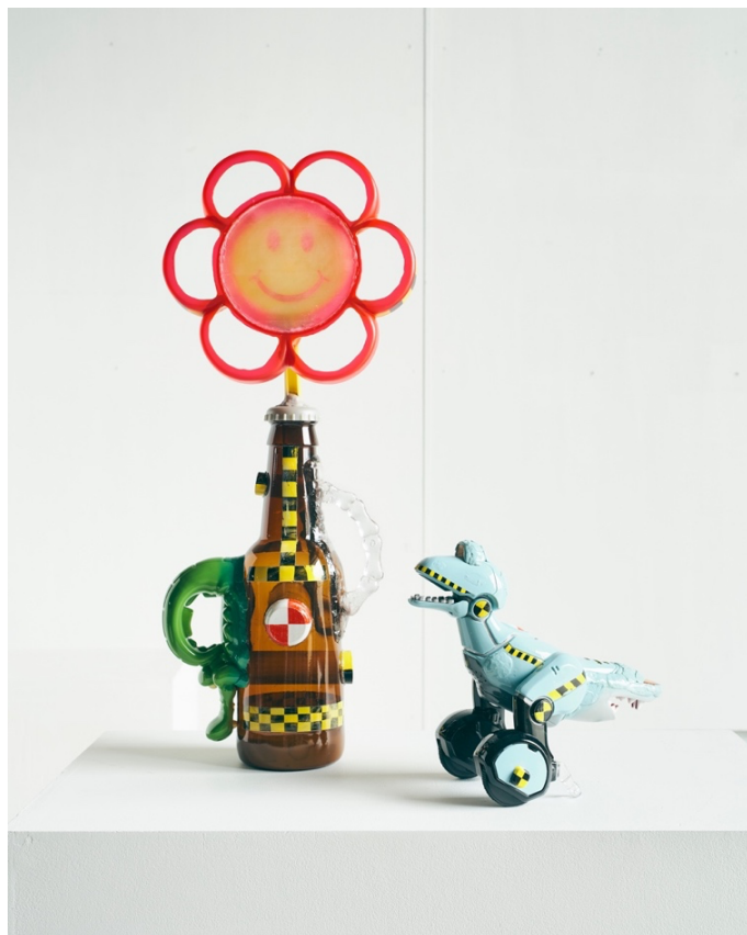
Kenichi Miyazawa 'CLASH BOTTLE'(左) 2022, mixed media, W215 x H610 x D125mm

また、本展を記念して、全国の金物仏具の国内シェア 9 割を誇る富山県高岡市の伝統産業とセッションした エディション作品の受注販売をおこないます。