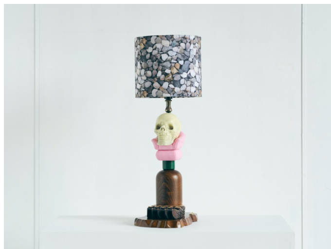
magma 'Law of nature lamp' 2022, mixed media, W200 x H250 x D530mm