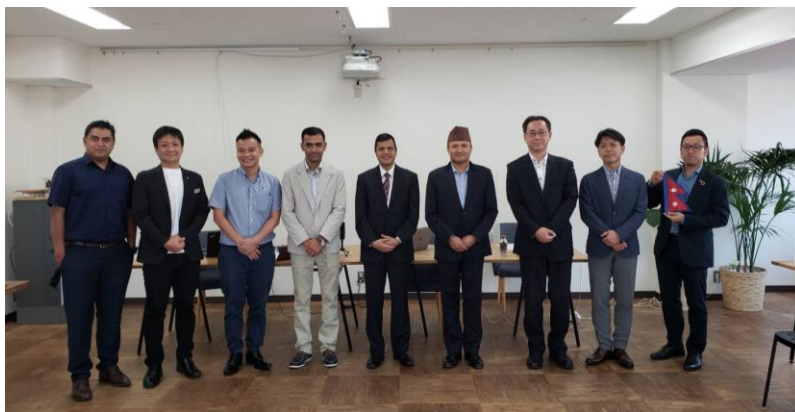
在日本ネパール国大使館参事官アンビカ ジョシ氏との集合写真 (写真中央)

結果的に、本事業のクライアントはネパール人材の技術能力を高く評価していることに繋がっているため、日本の IT 産業発展にネパールの強みを活かしていることを評価しています。