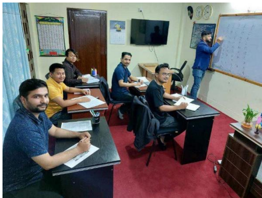
第2期5名のネパール人材に対する日本語教育の様子

また第2期5名のネパール人材についても、事前に日本企業就職内定を得たうえで、8月より日本語教育を開始しており、12月末までの日本語能力 N4 相当の教育カリキュラムを実施します。