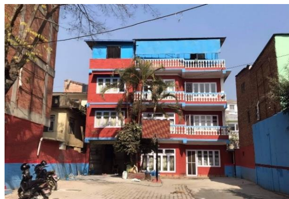
現地に開設した教育施設