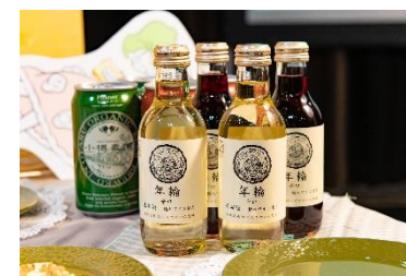
会場で提供予定の「小樽麦酒」、 はこだてわいん「年輪」