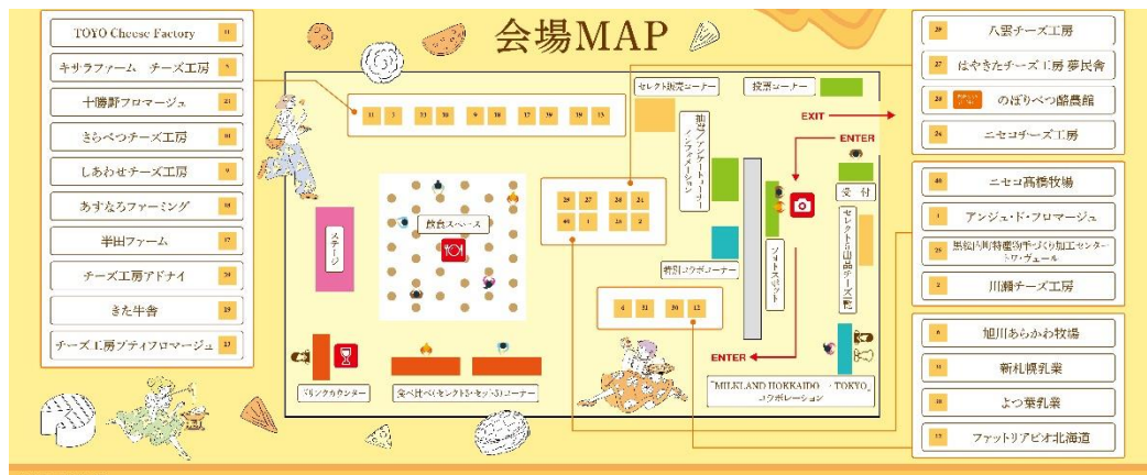
会場 MAP(出店工房・メーカー記載)