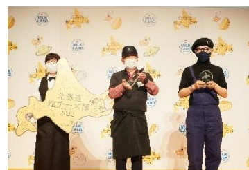
「北海道地チーズ博総選挙 2022」 授賞式の様子

昨年は、デザートチーズ二世古 雪花[sekka]パイアヤ&パイナップルがグランプリを受賞しました。