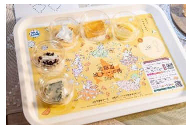
「セレクト5」「セット5」の提供イメージ

全46種の中から好きな地チーズ5種が選べる「セレクト5」に加え、チーズに詳しくない方でもカジュアルに楽しめるよう、テーマ別に選ばれた「セット5」が初登場します。ビールやワインをはじめとした各種ドリンクとともに、北海道地チーズとのマリアージュをご堪能ください。