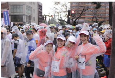
出走を控えやる気十分のメンバー