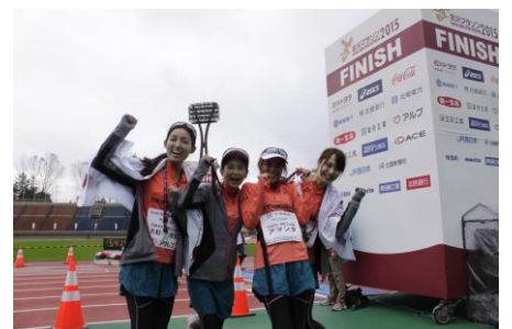
メンバー全員で完走した笑顔の記念撮影