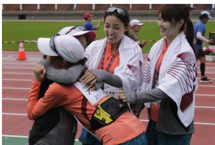
ゴールをしたアマダを迎えるメンバー