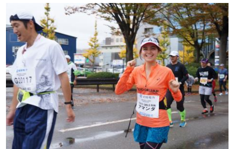
緊張しながらも笑顔のアマダ