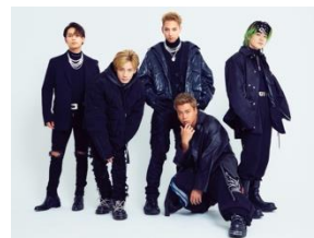
MA55IVE THE RAMPAGE

2023年1月14日（土）は、出演モデル、アーティスト、ゲスト、そして来場されるお客様の“パワー”が3年ぶりに静岡に再集結します！ 明るい未来のために手と手を取り合い、輪となって静岡から世界を変えていく。SDGs推進 TGC しずおか 2023の今後の展開をお見逃しなく！