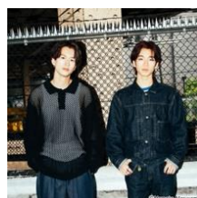
もーりーしゅーと