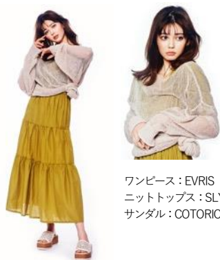
ワンピース：EVRIS ニットトップス：SLY サンダル：COTORICA

うちでも外でも、あなたを優しく包んでくれる心地のいい服。とにかく自分を癒してくれるアイテムをセレクトしましょう。おうち時間を贅沢にしてくれるホームドレスっぽい雰囲気のアイテムを始め、気分が落ち着くナチュラルで馴染みやすいカラーがオススメです。ストーンと締め付けのないストレスフリーなシルエットや、履いていて苦じゃないフラットシューズはマストアイテム！