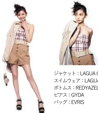
ジャケット：LAGUA GEM スィムウェア：LAGUA GEM ボトムス：REDYAZEL ピアス：GYDA バッグ：EVRIS

フィジカルな旅ができなくても、脳内旅行は誰でもできます。世界中を旅するような、心も体も解放してくれるヘルシーなアイテムを積極的に取り入れましょう！中でも、水着をインナーとして活用したり、旅気分アイテムをプラスすることが気分を上げるポイント！思い切って足を出すのもオススメです。