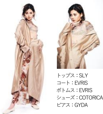
トップス：SLY コート：EVRIS ボトムス：EVRIS シューズ：COTORICA ピアス：GYDA

自然への賛美と地球への感謝を込めて、今季はアースカラーや大地や植物の生命力を感じる素材、自分自身を解放してくれるプリントやカラーが気分です。特にオススメなのは「地層」柄。カジュアルだけではなく、モードっぽく着こなせるのがポイント。柄にパンチがあるので、全体のテンションがバラバラにならないようにトーンを揃えましょう。