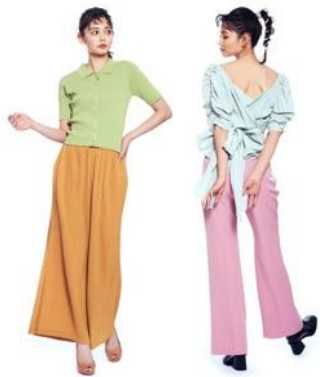
(左) トップス: EVRIS/ボトムス: M. (右) トップス: RESEXXY/ボトムス: ROYAL PARTY ブーツ: LAGUA GEM

今季のリコメンドスタイリングは、「ワントーン+1」。今までのトレンドだったワントーンコーデの進化版で、トーンを揃えてトップスとボトムスで色を変えるのが今季流！ポイントは必ずトーンを揃えること！そうすることで、喧嘩せず最新スタイリングが完成します。