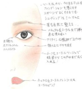
トレンドメイク 2017 S/S