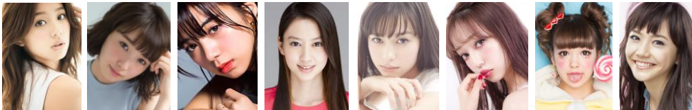
朝比奈彩 飯豊まりえ 池田エライザ 河北麻友子 中条あやみ 中村里砂 藤田ニコル 松井愛莉