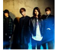
THE BEAT GARDEN