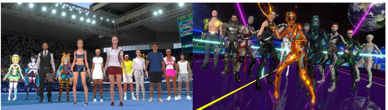
プレイヤーキャラクターたち。健全な人 (左) VS サイバーパンク軍団 (右) の対立というストーリーです。