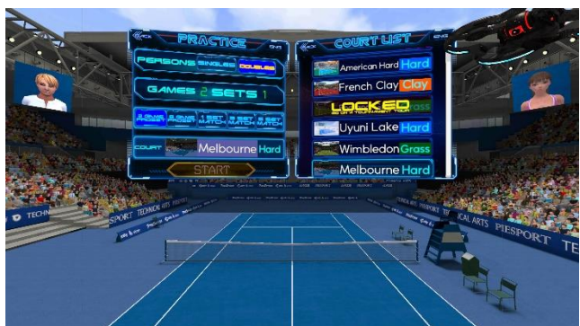
コート選択時は、VR空間でコートを実感できます