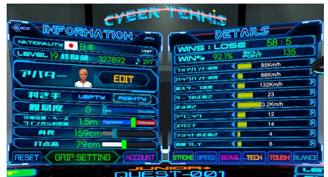
プレイヤーのスキルを細かく設定できます