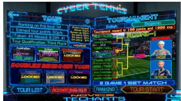
トーナメントを転戦するツアープレイ