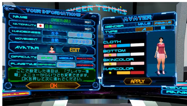
プレイヤーキャラクター作成画面

対戦相手から見えるプレイヤーのアバターキャラクターをいくつかの選択肢から選んで作成します。