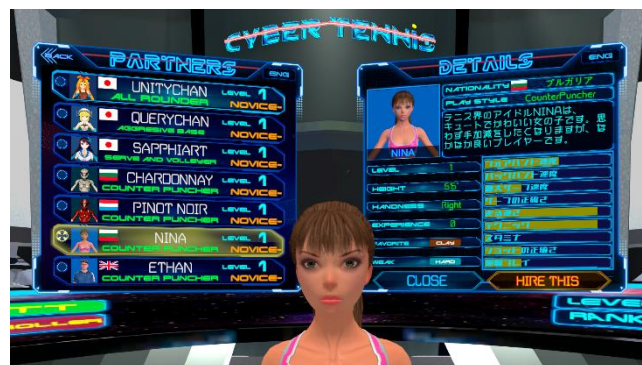
パートナーキャラクター選択画面